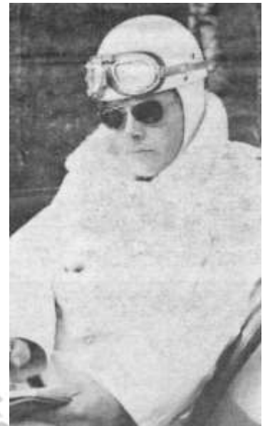
Korte melding in dagrapport

Na één en ander in het dagrapport te hebben vermeld draaien wij weer rijksweg 12 op.